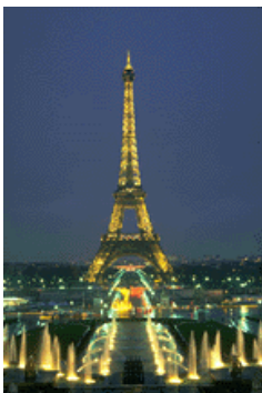
Bildtext som beskriver bilden.

Om det finns plats är det här en bra plats att infoga en clipart-bild eller andra bilder.