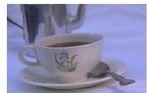
Bildtext som beskriver bilden.

När du har valt en bild, placerar du den nära artikeln. Se till att du placerar bildrubriken nära bilden.