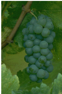
Bildtext som beskriver bilden.