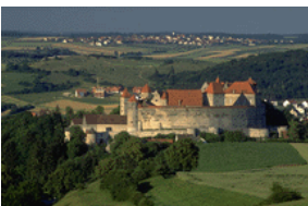
Bildtext som beskriver bilden.

När du har valt en bild, placerar du den nära artikeln. Se till att du placerar bildrubriken nära bilden.